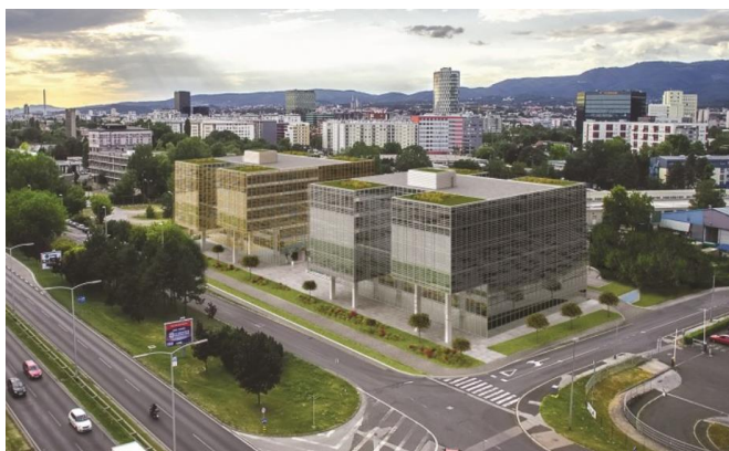
GTC Matrix Office Park, 1. faza, 10.000 m 2 GLA